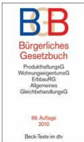
BGB aktuelle Taschenbuchausgabe

Weitere Bücher werden zu Studienbeginn im Januar 2017 von einzelnen Dozenten empfohlen bzw. eine detaillierte Literaturliste erstellt.