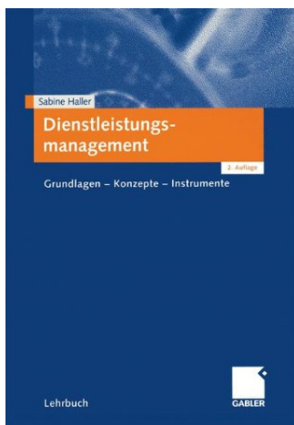
S. Haller: Dienstleistungsmanagement (neuste Auflage)